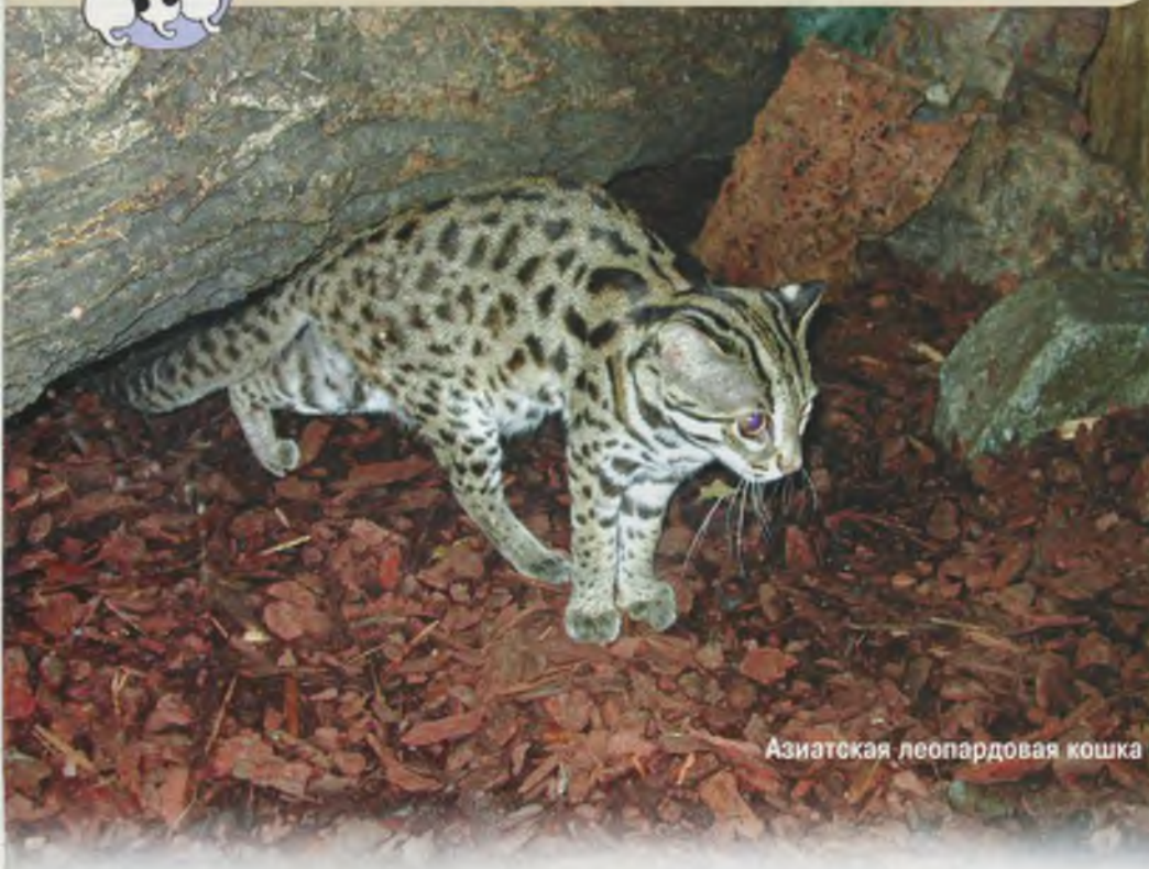
Азиатская леопардовая кошка

Азиатская леопардовая кошка (АЛК) имеет не так много вариантов окраса: браун тэбби, белый пятнистый животик, плюс пятна или розетки горизонтальной или диагональной направленности. Вроде бы все. Но в процессе ее скрещивания не